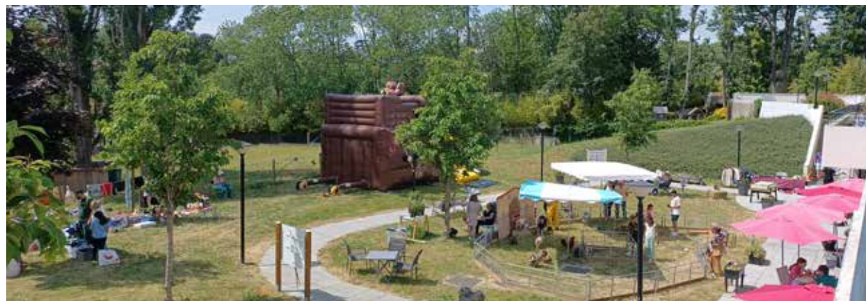
Brocante dans notre parc, ouverte sur l'extérieur pour familles, résidents, salariés

Participer à la vie de la Cité, faciliter les rencontres et les échanges intergénérationnels, encourager la socialisation par des activités et sorties variées.