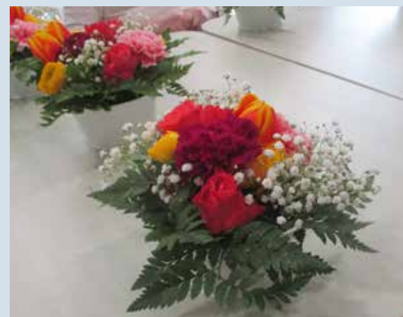
Tous les mois, atelier floral pour les centres de tables