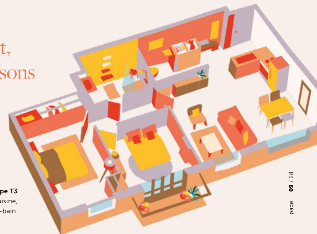
Appartement de type T3 2 chambres, salon, cuisine, salle à manger, salle-de-bain.

Cet appartement, nous en garantissons le caractère d'exception.